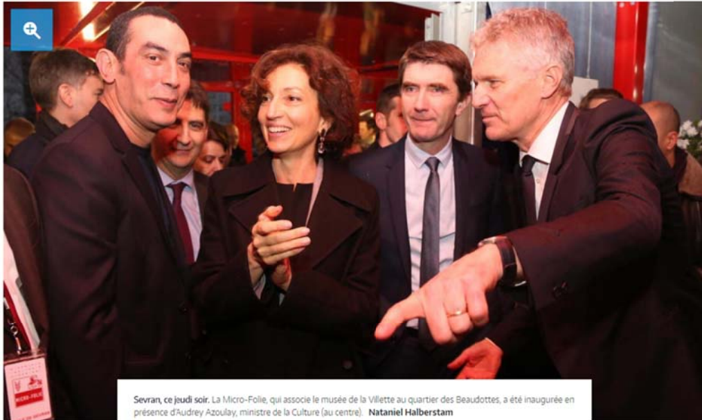
Sevran, ce jeudi soir. La Micro-Folie, qui associe le musée de la Villette au quartier des Beaudottes, a été inaugurée en présence d'Audrey Azoulay, ministre de la Culture (au centre).